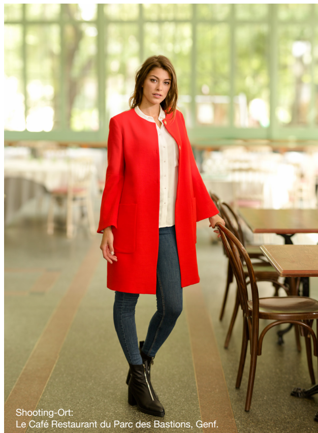
Shooting-Ort: Le Café Restaurant du Parc des Bastions, Genf.

Ob dekorativer Zierstich oder praktischer Nutstich, Sie werden von der Präzision und Gleichmäßigkeit des Stichbildes begeistert sein. Bei Modell 570 können Sie Ihre individuellen, einzigartigen Stichfolgen speichern.