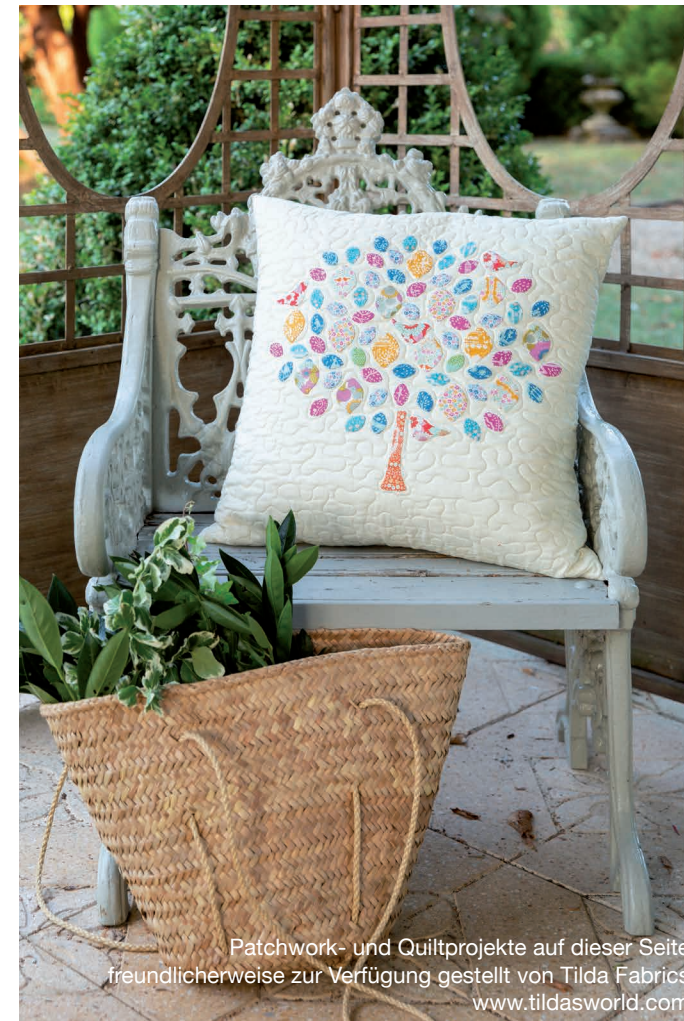
Patchwork- und Quiltprojekte auf dieser Seite freundlicherweise zur Verfügung gestellt von Tilda Fabrics www.tildasworld.com

Mit ihren vielen Funktionen der Extraklasse, hoher Nähgeschwindigkeit und einer Auswahl von 350 Stichen bietet Ihnen die eXcellence 780+ eine eindrucksvolle Nähleistung, inklusive 3MB Speicherkapazität. Konstruiert mit einem Metallrahmen, der große Stabilität bietet, können Sie mit dieser Maschine über Stunden mit der gleichen präzisen Stichqualität nähen.