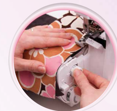
Übersichtliche Anordnung der Einstellregler