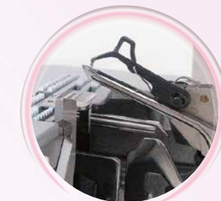
Robuste Greiferkanäle mit klappbarem Hilfsgreifer