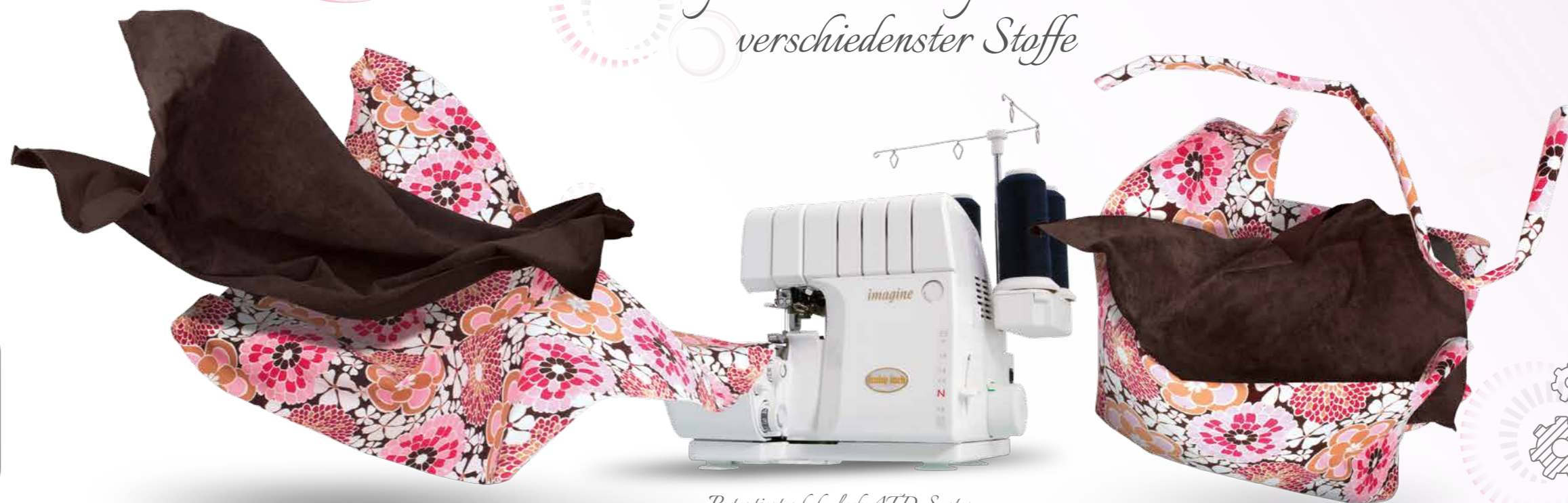
Patentiertes baby lock ATD-System