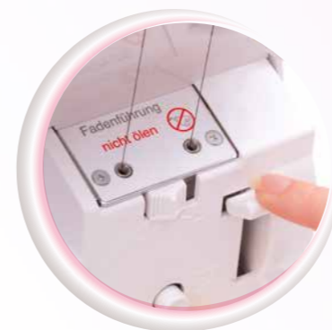
Jet-Air Threading™ System